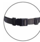
Cierre trasero de 15 mm