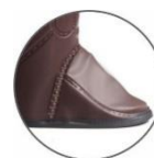
Pico con metatarso