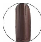
03 tablas frontales de PVC