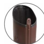
Cerradura de soldadura electrónica